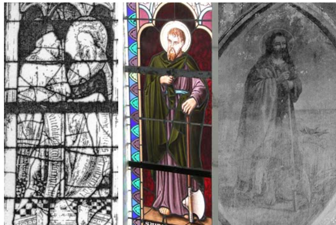
Quemper-Guezennec (22) St-André-des-Eaux (44)

° A l'église Saint-André de Saint-André-des-Eaux (44), un vitrail (fin XIX e ou début XX e siècle) représente saint Jacques tête nue auréolé, vêtu d'une robe mauve ceinturée de bleu. Il tient dans la main gauche l'instrument de son supplice, curieusement représenté par une hache au long manche.