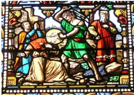
Le Fresne-sur-Loire (44)