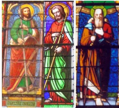
Plemet (22) Saint-Viaud (44) Landavran (35)

° Dans l'église Notre-Dame de Landavran, les vitraux des baies n°1 et 4 sont composés d'éléments du XIV e siècle incorporés dans une restauration du XIX e . La représentation de saint Jacques date du XIX e siècle. Le saint se présente tête nue auréolée et pieds nus, vêtu d'une robe et d'un manteau, la main gauche sur le cœur, un bourdon avec gourde dans la main droite.