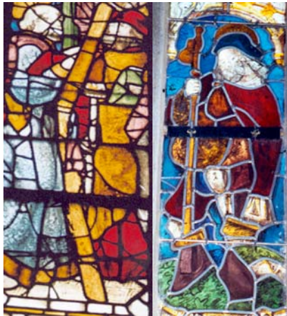
Le Conquet (29)