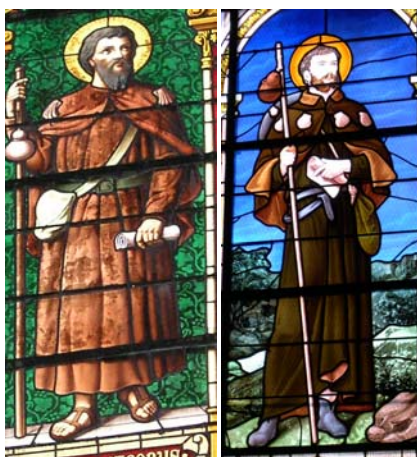
Le Loroux-Bottereau (44)

° A l'église Sainte-Madeleine de Barbechat (44), une verrière du XIX e siècle représente saint Jacques tête nue auréolé, chapeau dans le dos, vêtu d'une robe, d'un manteau et d'un mantelet garni de coquilles, besace du côté droit. Il tient à la main droite un grand bourdon avec gourde et le livre sur l'avant bras gauche. Sandales aux pieds. Inscription sur le socle : « S t JACQUES le MAJEUR »