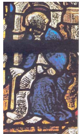
Saint-Jacques en majesté

° A droite, saint Jacques est assis en majesté à la porte de sa cathédrale, pour accueillir les pèlerins. Il s'appuie sur un bâton en tau