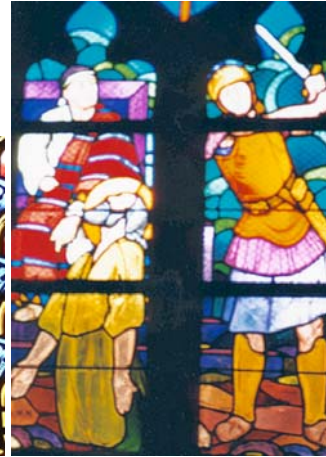
Belle-Isle/ Locmaria (22)