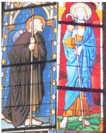
Oudon (44) Dinard (35)

° A l'église Saint-Martin de Oudon (44), une verrière du XIX e ou XX e siècle présente saint Jacques, tête nue, chapeau dans le dos, vêtu d'une robe et d'un manteau tombant jusqu'à ses pieds nus. Il s'appuie des deux mains sur un grand bourdon muni d'un crochet à son extrémité (pour accrocher la gourde). L'air sévère, il a le regard fixé sur l'horizon. Inscription : « SAINT.JACQUES.LE MAJ r »