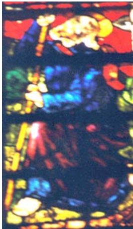
Les Iffs (35)