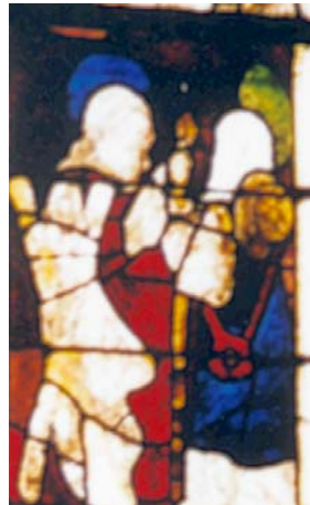
Le Faouët (56)

° A la basilique Notre-Dame du Roncier de Josselin (56), dans la baie n°10 de la basilique (XV e siècle restauré au XIX e ) Saint Jacques auréolé porte son chapeau derrière la tête et tient son bourdon à la main droite. Au bas du vitrail, sur le support, inscription: « St JACOBUS MAJOR ». (Inscrit MH)