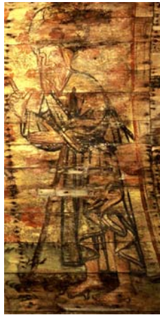
Avec les démons