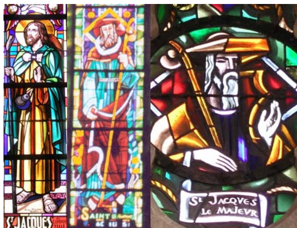
Pannecé (44) Nantes-Pirmil (44)

° A l'église Saint-Jacques de La Planche (44), le tympan de la porte principale est constitué d'un vitrail représentant saint Jacques en buste. Coiffé d'un grand chapeau, vêtu d'une robe et d'un manteau, il tient un grand bourdon avec gourde dans la main droite et bénit de la gauche. Un phylactère porte l'inscription : « S' Jacques le Majeur ».