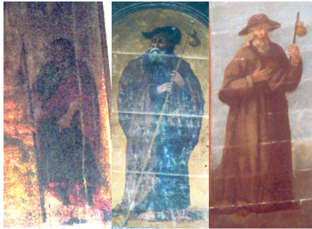
Séglien (56) Cloître-St-Thégonec (29) Dirinon (29)

° A l'église Sainte-Nonne de Drinon (29), les lambris du transept présentent des peintures des Apôtres (XIX e siècle). Saint Jacques porte un grand chapeau et une pèlerine sur une robe à peine plus claire. Aucune coquille apparente, ni livre, ni besace mais un grand bourdon avec gourde.