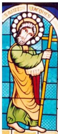
Le Conquet (29)