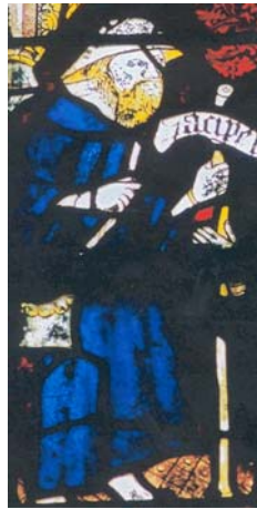
« Reçois ce bâton... »