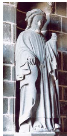
Le Folgoët (29)