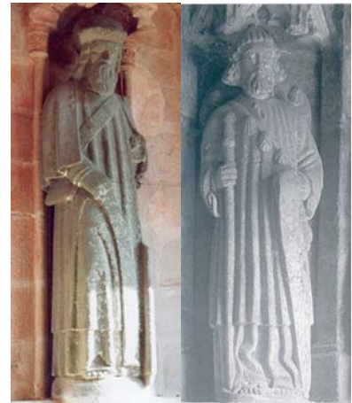
Primelin (29) Saint-Servais (22)

° A la chapelle Notre-Dame de Burtulet, en Saint-Servais (22), statue 6 de saint Jacques tête nue, le chapeau orné de coquilles rejeté dans le dos.