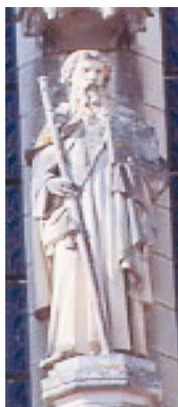
La Planche (44)