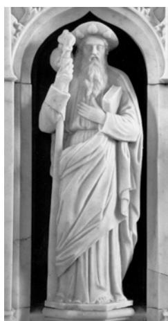
La Feuillée (29)