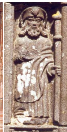
La Roche-Maurice (29)