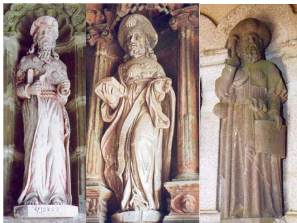
Le Faou (29)

° A l'église de la Sainte-Trinité de Lennon (29). Saint Jacques est vêtu d'une longue robe et d'un manteau dont le col forme mantelet portant de nombreuses coquilles. Une gourde pend à sa ceinture.