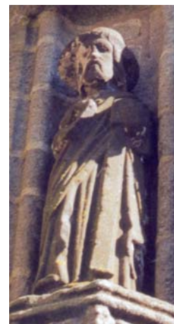
Pont-Croix - Confort (29)

° A droite, dans le pied-droit de droite du porche de l'église Notre-Dame de Confort-Meilars en Pont-Croix (29)), statue oeuvre 9 du « Maître de Plougastel ». La besace n'est pas visible.