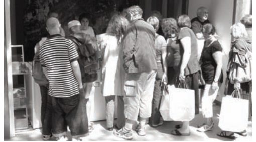
L'affluence devant le stand du Chemin de St-Jacques

Suite à notre activité durant le F.I.L. de nombreuses demandes de renseignements complémentaires et d'adhésion à l'association parviennent au délégué, que ce soit par téléphone, mail ou courrier.