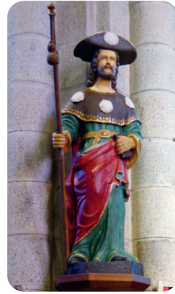
statue de saint Jacques le Majeur, église paroissiale de Belle-Isle-En-Terre (22), restaurée avec la participation de l'association.