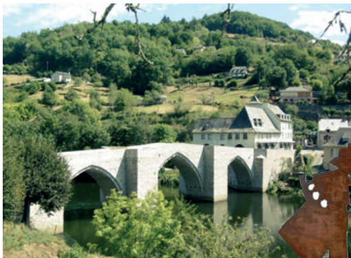
Le vieux pont d'Entraygues-sur-Truyère

Pour ce dernier jour, il reste 22 km pour rejoindre Conques. Nous empruntons les « carrals » (en occitan, chemin dans les bois) et les chemins d'exploitations qui tracent le plus souvent parmi les châtaigniers où des « sécadous » (séchoirs à châtaignes) sont les témoins d'une ancienne activité rurale. A Grand-Vabre, charmant petit village, le chemin quitte la vallée du Lot pour celle du Dourdou. C'est alors un beau parcours pentu, des fonds ombrés des vallées aux plateaux agricoles ensoleillés. Le GR oblique vers l'Est pour la lente et difficile descente vers Conques. Aux schistes acérés émergeant de la bruyère succèdent les roches arrondies par les innombrables pas des pèlerins vers Compostelle. A mi-pente, le belvédère de la chapelle Sainte-Foy révèle Conques au fond de la vallée de l'Ouche. C'est avec une joie profonde que nous retrouvons, dans l'abbatiale, les vitraux de Pierre Soulages que l'on peut aussi lire comme des « guides du Chemin ».