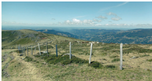
En redescendant du Plomb du Cantal

Les 14 kilomètres de l'étape entre Pailherols et Mur-de-Barrez traversent, par des sentiers étroits, de vertes coulées et des chemins d'exploitation, les hauteurs qui dominent la vallée du Goul, dans un rythme soutenu de montées et descentes. Au terme,