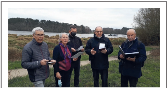
5 nantais ont chanté ce chant, en plein air, au bord de l'Erdre, et envoyé l'enregistrement aux autres choristes.