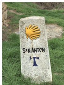
Borne avec Tau