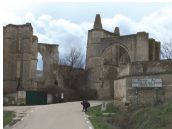
Abbaye San Anton

La croix de Tau est présente sur le toit du clocheton et dans la « rose » d'une fenêtre à remplage. A Sarría (100 km de Santiago), un édifice fondé en 1589 fut le siège local des Antonins et un hôpital pour pèlerins jusqu'au début du XIX e siècle.