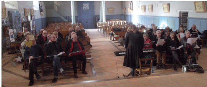
Répétition à l'église Bréal

Voici brièvement évoqué ce que vous n'avez pas pu voir à l'AG annulée du 7 mars. Un diaporama retraçait les activités 2019 du chœur avec nos chants en fond sonore.