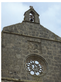
Abbaye San Anton