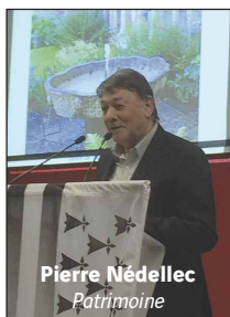
Pierre Nédellec Patrimoine