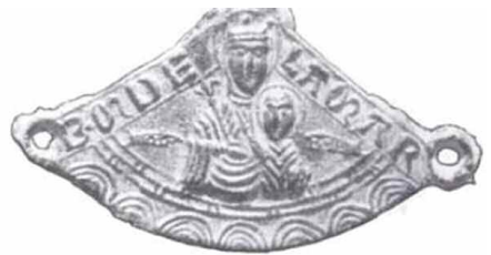
Enseigne de pèlerinage (Abbaye de Silvacane)

Le désir de fuir le quotidien, de voyager qui