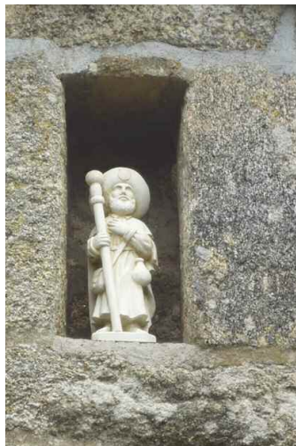
Petit St Jacques

Monsieur le président Au bout d'une semaine Voyez où elle nous mène La marche de printemps (...) Merci à Marie Flore Notre mère Courage Qui dans les jours d'orage A su nous protéger