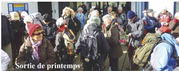
Sortie de printemps

Le point de départ de la sortie de printemps des amis de la délégation finistérienne était situé au port de l'Aber Wrac'h, sur la commune de Landéda.