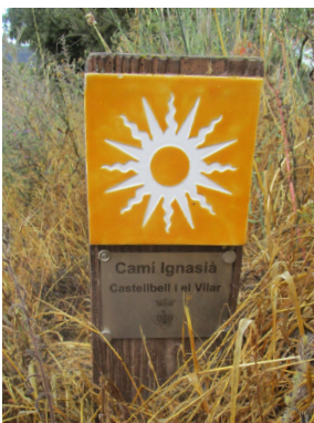
balise du Camino Ignaciano

dominante jaune, en été en tout cas. C'est le long de son cours, en aval de Saragosse que j'ai pu admirer, par trentaines, des cigognes perchées sur le même toit ou explorant le même champ à la recherche d'insectes, de limaces ou de vers. À Saragosse (César-Auguste pour les Romains) j'ai visité la très célèbre basilique du Pilar, où le préposé au tampon de credencial est probablement une Arlésienne, ainsi que le palais de l'Aljaferia, bijou de l'architecture islamique du XI e siècle, très rénové. L'Èbre se tortille en de nombreux méandres mais le chemin préfère la ligne droite passant par de superbes belvédères qui surplombent le fleuve. Et bientôt le pèlerin entre dans la province de la Rioja, aperçoit Viana, entre dans Logroño et retrouve le camino francés. Ce fut pour moi une joie de voir enfin des pèlerins. Le soir même nous étions six à dîner au pied de la cathédrale : une Espagnole, deux Parisiennes et trois Bretons de l'association ! J'ai poursuivi sur le camino francés, laissant pour une autre année la fin, ou plutôt le début, du camino Ignacio.