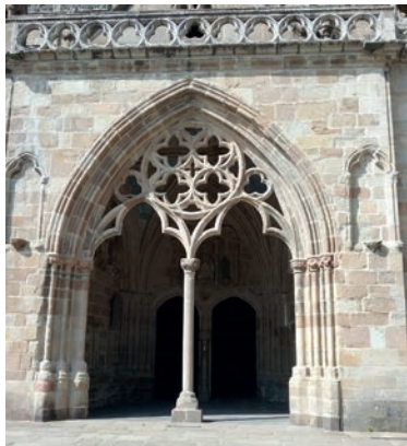
Porche de la façade sud

À l'intérieur : chapiteaux sculptés, enfeus, stalles, fresques du chœur, tableaux représentant des scènes de l'Apocalypse de saint Jean, ainsi que saint Yves entre le riche et le pauvre.