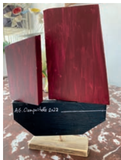
Belle maquette de bateau, symbolisant la journée à Locminé