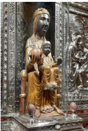
Vierge à l'Enfant ou Vierge noire de Montserrat (XI e siècle)