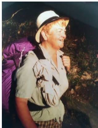
« Une redoutable marcheuse » ...

Elle s'est consacrée à fond dans cette histoire. Je l'ai vue s'épanouir totalement là-dedans. Jusque-là, elle était la femme de l'écrivain. Toujours pèlerine, mais en retrait. Quand elle est devenue présidente, ce n'était plus la femme de l'écrivain. Ça rééquilibrait. Et puis son vieux fond catho est ressorti. Elle a renoué avec l'église. Dans l'association, il y avait beaucoup de militaires et de